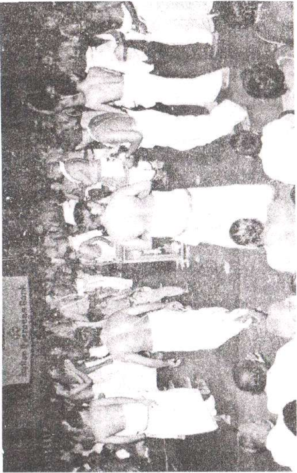
'ஸங்கீர்தன ஸப்தாஹம்' வைபவத்தில் மற்றொரு நிகழ்ச்சி.