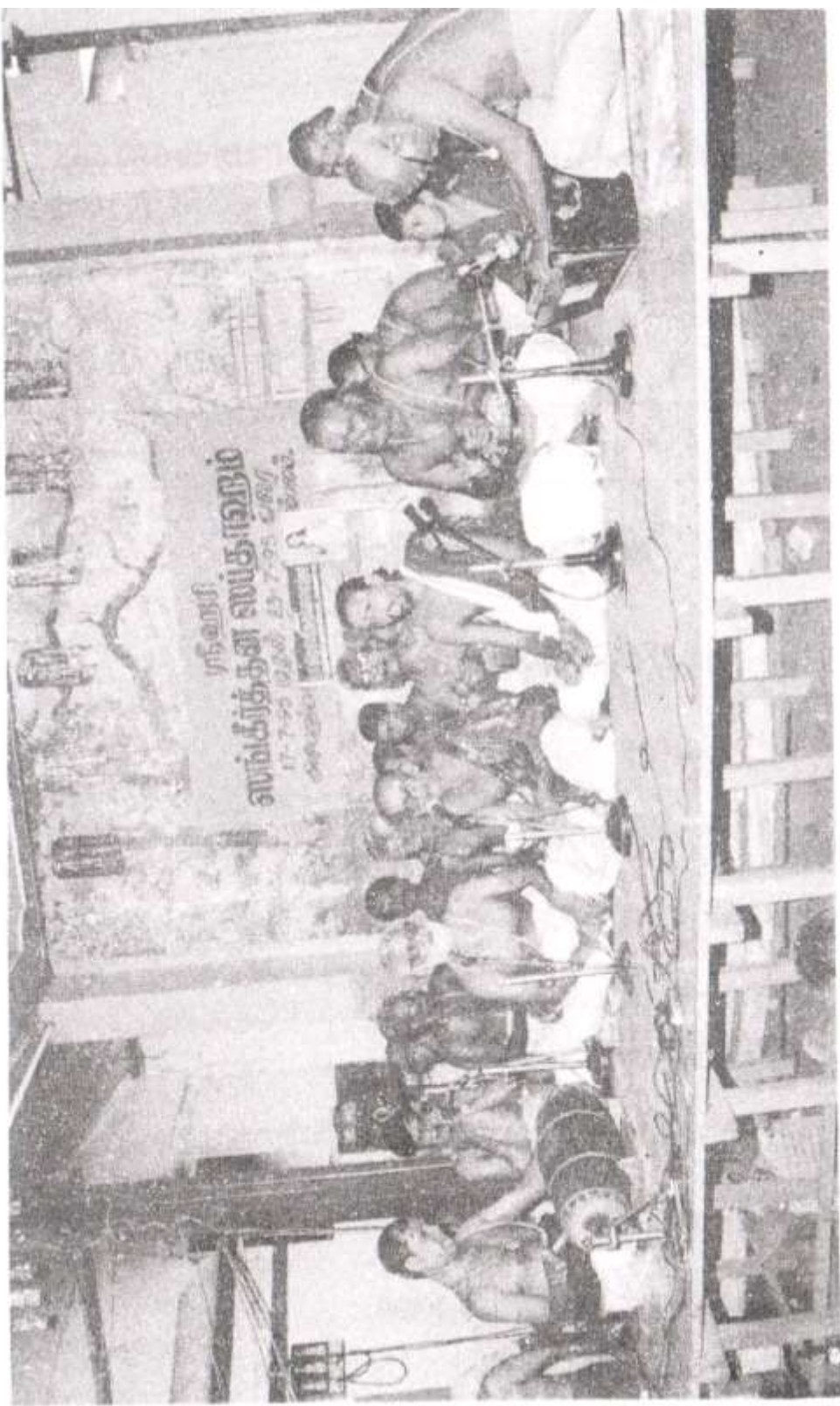
'ஸங்கீர்த்தன ஸப்தாஹம்' வைபவத்தில் ஸ்ரீ ராதா கல்யாண நிகழ்ச்சி.